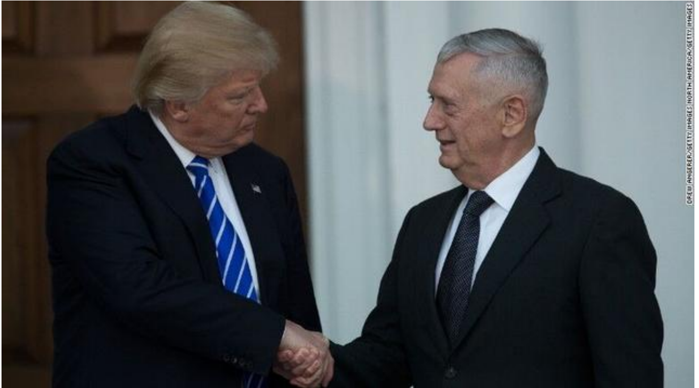
资料图：特朗普（左）和马蒂斯（右）

据美国《华盛顿邮报》12月1日报道，美国下任总统特朗普选择传奇退休将军马蒂斯 (James Mattis) 担任国防部长。特朗普团队再添一名“硬汉”。