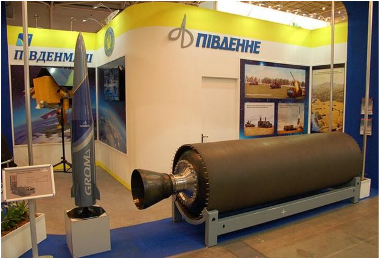
俄方此前担心乌克兰借试射防空导弹名义试射弹道导弹